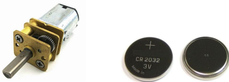
图 2 电动机和电池

2. 装置动力系统的电动机和电池采用指定型号（电动机：N20 减速电动机，3V，100 转/分钟，数量 1 个；电池：CR2032，数量不超过 2 个，不指定厂家，见图 2）。电子元件（只能是开关、电池底座）及涉及运动的机械零件（如不可拆解的齿轮、齿条、轴等）可以自行采购。除电动机电池外不得安装其他使用电能的装置，小车的所有动力均通过电动机输出。